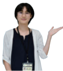
資産税課 申町 主事