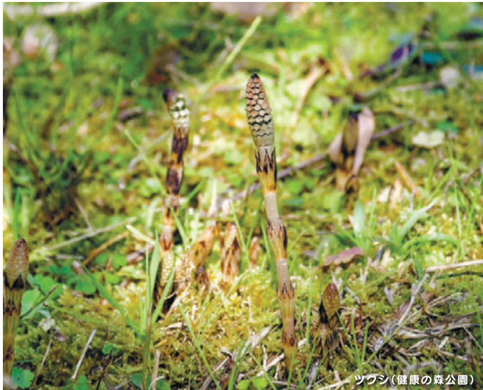
ツグシ(健康の森公園)

※新型コロナウイルス感染症の関係で、講座やイベント等の中止や延期など、掲載した情報が変更になることがあります