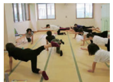
リフレッシュヨガ(たにっこりん)