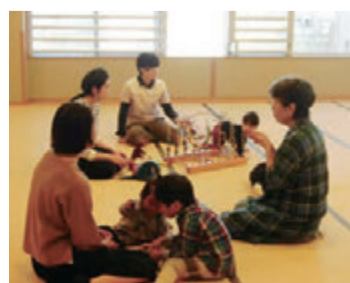
助産師と気軽に語ろうかい(なかまっち)

◇受講決定者には受講票を送付 料①③～⑭無料、②550円 申①④⑦⑬は不要、②③は3月10日、⑤は3月16日、⑥は3月19日まで、⑩は3月26日から、⑧は3月10日～16日に直接か電話、ファクス、メールで各親子つどいの広場へ ※⑨⑪⑫⑭は当日受け付け ◇託児は生後2カ月～就学前の子ども