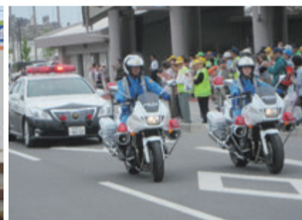
交通機動隊出発式