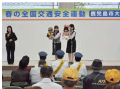
交通安全に関する腹話術