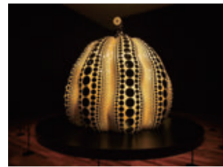
草間彌生《大いなる巨大な南瓜》 2017年 (c) YAYOI KUSAMA

アートの力で新たな人の流れを呼び起こすプロジェクト。松本市美術館がプロデュースする「パルコde美術館」では、12人の現代アーティストの多様な表現世界を紹介。市内の店舗との連携イベントも開催中。