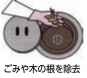
ごみや木の根を除去

に付着したごみや侵入した木の根は、詰まりの原因となるので定期的に取り除いてください