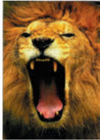
昨年度市長賞受賞作品

昨年7月以降に撮影した同公園の風景や動植物、錦江湾公園内の景観や植物の写真を募集します。 ◇申込期限 7月5日(必着)