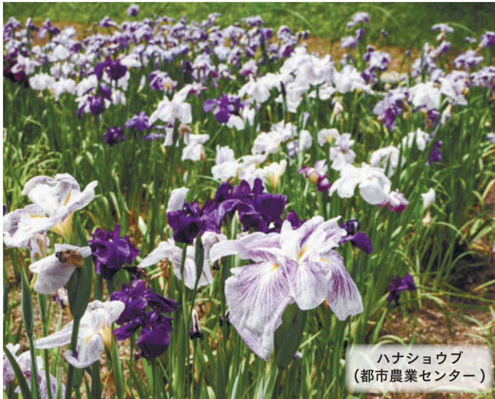
ハナショウブ (都市農業センター)

※新型コロナウイルス感染症の関係で、講座やイベント等の中止や延期など、掲載した情報が変更になることがあります