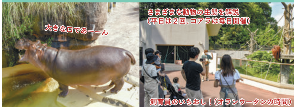
さまざまな動物の生態を解説 (平日は2回、コアラは毎日開催)

※新型コロナウイルス感染症の関係で、講座やイベント等の中止や延期など、掲載した情報が変更になることがあります