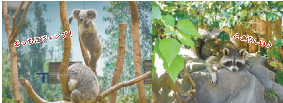
新たな発見、出会いがいっぱい！ 平川動物公園