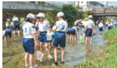
市内の小学校を紹介する「私たちの学校自慢!」。今月は、和田川での学習が自慢の「和田小学校」です(8月11日放送)