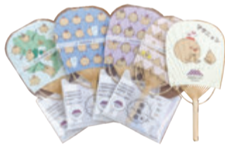
※1本(全長23cm程度)をプレゼントします(種類は選べません)