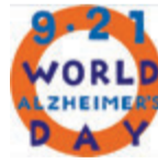
アルツハイマーデー ロゴマーク

申電話かファクス、申し込みフォームで10月11日までに長寿あんしん相談センター本部 ☎813-8555 FAX813-1041へ