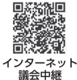
インターネット 議会中継