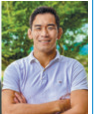
10月8日のゲスト 桑水流 裕策氏(元7人制ラグビー日本代表)