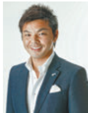
10月7日のゲスト 城 彰二氏(元サッカー日本代表)