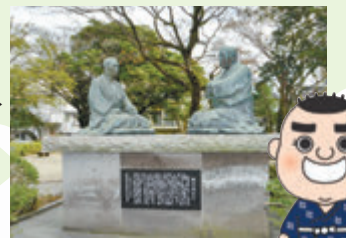
○○○○○○と庄内藩元家老・菅実秀の対談を表した銅像（武二子目）

2 戊辰戦争で戦火を交えた庄内藩（現在の山形県）。敗戦後の○○○○○○の寛大な措置に感動したことから始まった交流がその後発展し、1969年に鶴岡市と兄弟都市盟約を結びました ※歴史上の人物