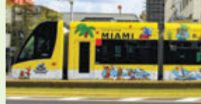
アメリカ・マイアミ市