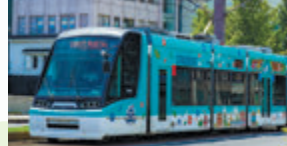
フランス・ストラスブール市