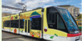
イタリア・ナポリ市