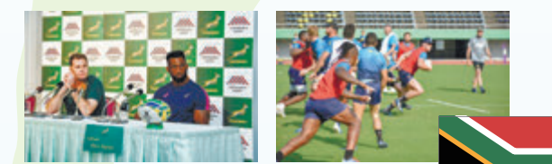
2019年のキャンプの様子

12 昨年のラグビーワールドカップでは、2019年の日本大会のときに本市でキャンプを行った南○○○○共和国が連覇を達成しました