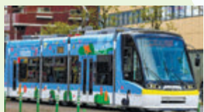
オーストラリア・パース市