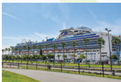
全長290m、乗客定員2700人超のイギリスの大型客船「ダイヤモンド・プリンセス」

2 戊辰戦争で戦火を交えた庄内藩（現在の山形県）。敗戦後の○○○○○○の寛大な措置に感動したことから始まった交流がその後発展し、1969年に鶴岡市と兄弟都市盟約を結びました ※歴史上の人物