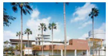
鴨池公園水泳プール