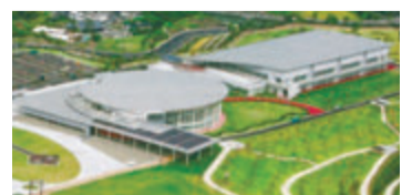
鹿児島ふれあいスポーツランド

■希望施設や提案額などを事前協議の上、直接か郵送で事前相談書(市HPからダウンロード可)を〒892-8677山下町11-1管財課☎216-1158FAX216-1162へ