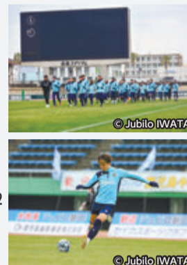
川島 永嗣 選手 (サッカーW杯2022 日本代表)