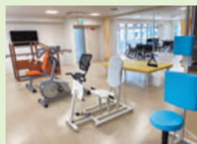
【機能訓練室(マシントレーニング)】 柔道整復師・機能訓練士による機能訓練