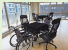
【娛樂室(麻雀台)】 車椅子のままご利用できます