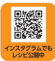
Instagramでも レシピ公開中