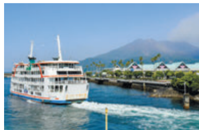
桜島フェリー90周年を記念して開催するパネル展や、クルージングなどのイベントを紹介します。(10月13日放送)