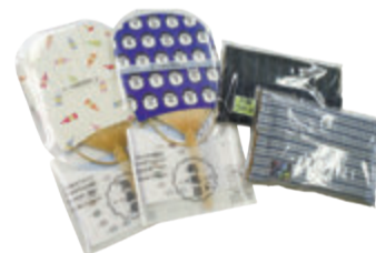
※デザインは選べません

正解者の中から抽選で、鹿児島を感じられるさつまこうちわ「南風扇-HAESSEN-」と、大島紬の生地を使用して作られたコンパクトティッシュケースを、それぞれ2つずつセットにして5人にプレゼントします。